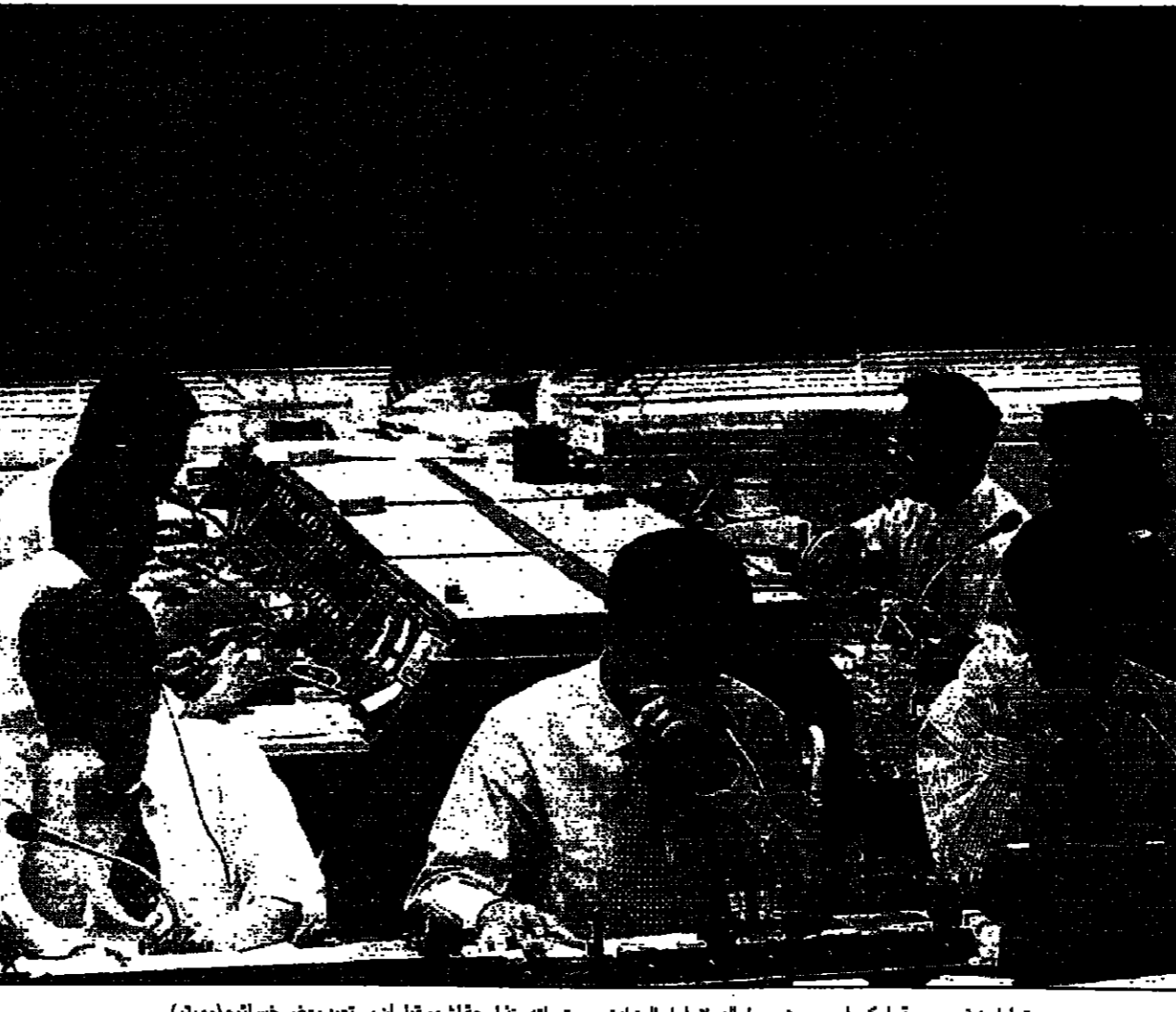
متماملين في بورصة طوكيو امس حيث سجل الدولار امام الين اندي مستقراته منذ اربعة اشهر قبل ان يستعيد بعض خسائره

صرح وزير الاقتصاد والمالية الكويتي محمد خان امس الاثنين بأنه سيناقش مع المسؤولين الكويتيين مشروع إقامة مصنع صلب مشترك بالكويت.